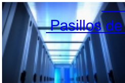
Pasillos de contencion termica (0)