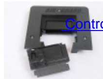
Control aire suelo tecnico (4)

Network Engineering dispone de los componentes necesarios para que su Datacenter sea eficiente, y consuma mucha menos energía eléctrica. Pasillos de contención térmica, preparados para nuevas instalaciones o para ser adaptados a CPD existentes, incluso sin tener que modificar su instalación de extinción de incendios, gracias a nuestras compuertas de techo automáticas. Para reconducir correctamente los flujos de aire en el suelo técnico, evitando escapes y presiones negativas, y para cerrar los pasos de cables correctamente. Queremos que el caro aire refrigerado solo esté donde tiene que estar; en tu pasillo frío.