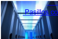
Pasillos contencion AdaptisIT (0)